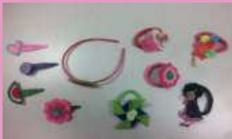
Coleteros, diademas y ganchos